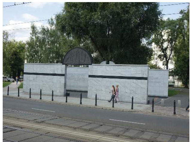
Zynische Nazibezeichnung: „Umschlagplatz“

Täglich wurde von hier aus ab 22.7.1942 die jüdische Bevölkerung des Ghettos nach Treblinka abtransportiert. 5.000 bis 6.000, manchmal sogar bis zu 10.000 Menschen an einem Tag. Das Mahnmal ist gestaltet in Form eines Güterwaggons. Unfassbar und traurig.