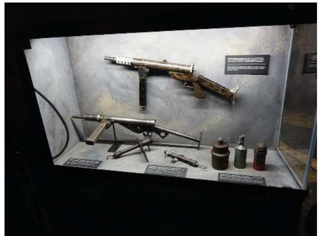
Waffen des Aufstandes im Museum

Schüsse und Granaten anrichten. In dieser Situation habe ich den Deutschen auch Menschen gesehen. Ich habe in dieser Situation geweint, aber ich wusste, dass ich weiterkämpfen musste, denn sonst kämen sie zurück und setzten das Töten fort. Und von diesem Moment an habe ich den Krieg gehasst.