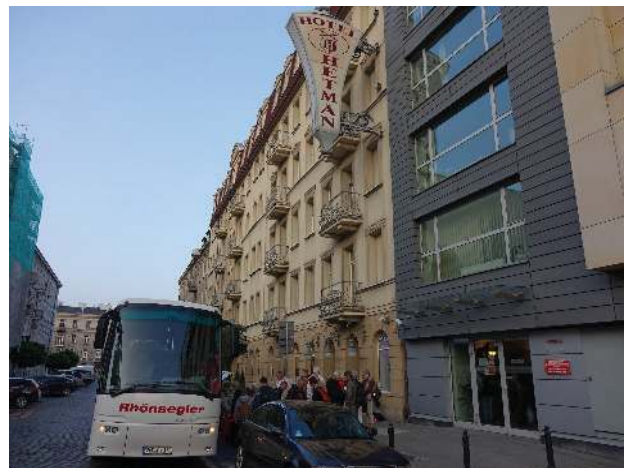
Ankunft vor unserem Hotel

kommen pünktlich um 18.40 Uhr im Warschauer Stadtteil Praga vor unserem Hotel HETMAN an. Praga liegt auf dem rechten Weichselufer, gegenüber der Altstadt. Das Hotel bietet neben seiner sehr günstigen Lage (Metro, Tram und Busse ca. 7 min Fußweg entfernt) einen guten Komfort, wir fühlen uns auf Anhieb wohl. Um ca. 19.30 Uhr tref-