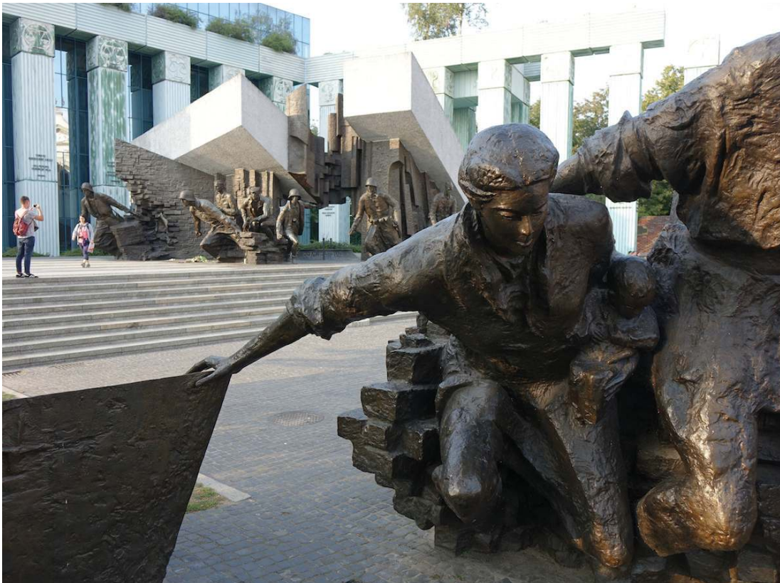
Denkmal für den Warschauer Aufstand

Am 16. April 2015 erhielt Wanda Traczyk-Stawska mit 19 weiteren Veteranen des Warschauer Aufstands das Verdienstkreuz am Bande des Verdienstordens der Bundesrepublik Deutschland.