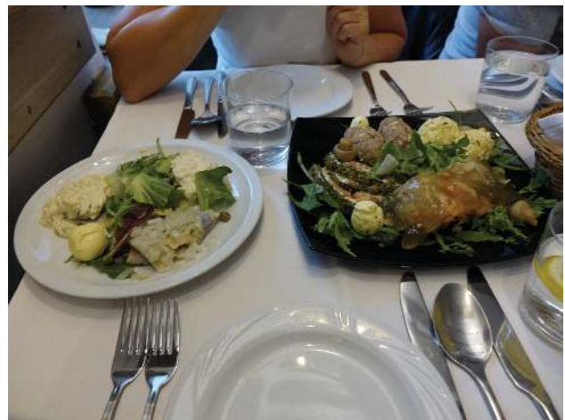
Polnische Küche auf hohem Niveau

Am Abend speisen wir in einem alteingesessenen polnischen Lokal in der Alt-/Neustadt, sehr reichlich und sehr gut. PodSamsonem! Wir essen wie die Helden.