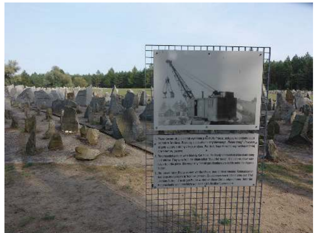
Auf dem Gelände: Die Abbildung zeigt einen der Bagger, der die Massengräber aushebt.

Die i.d.R. jüdischen Sonderkommandos mussten diese Arbeit verrichten, danach – so wussten sie –