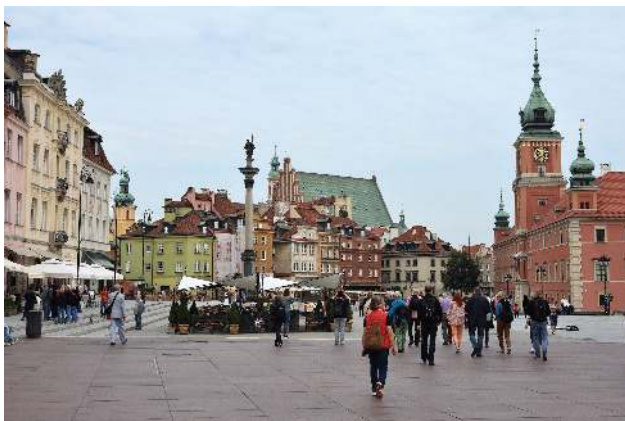
Blick auf die Altstadt, Königsweg

Um 9.00 treffen wir unseren Guide Marzena , die uns durch die Warschauer „Alt- und Neustadt“ führen wird. Ich habe das Gefühl, sie weiß alles und sie kann dieses Wissen gut dosieren und rüberbringen, sodass wir gut eingeführt werden in das heutige Warschau.