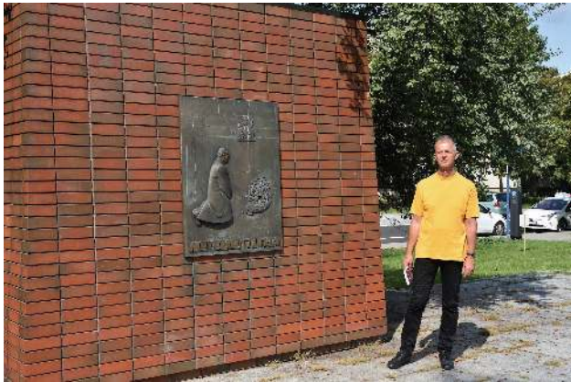
Erinnerung an den Kniefall Willy Brandts

unbewohnt, doch in den Ruinen und in den Kanälen überlebten noch einige Menschen.