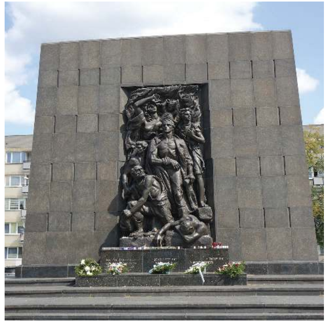
Denkmal für den Ghettoaufstand

polnischen und jüdischen Bevölkerung gezeigt. Pädagogisch geschickt, vielfältig. Sehr sympathisch.