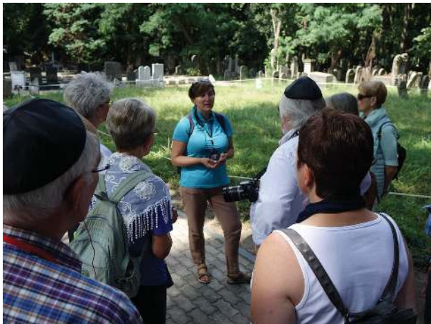
Am Massengrab (100.000!) auf dem jüdischen Friedhof

An dieser Stelle, dem Denkmal des Ghettoaufstands, fand 1970 der Kniefall des deutschen Bundeskanzlers Willy Brandt statt, der für die Aussöhnung beider Völker – der Polen und der Deutschen – eine große Rolle spielt. Ich verstehe, warum die Polen diesen Kniefall mit einem eigenen Denkmal bedacht haben. Das Terrain des Ghettos war z.T. auch deckungsgleich mit dem des Warschauer Aufstands 1944, also konnte Brandts Geste auch beiden Ereignissen gelten.