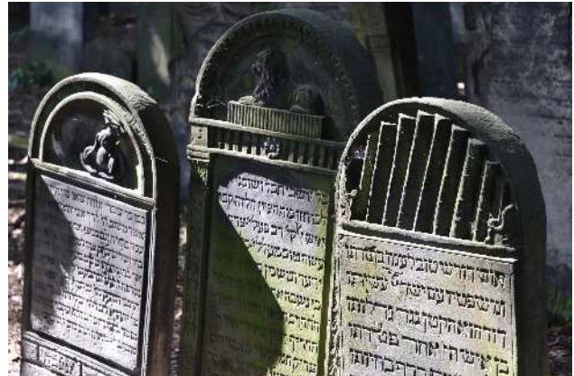
Gedenksteine auf dem „Ghetto“-Friedhof

der mit den ihm anvertrauten Kindern ins Gas und damit in den Tod ging, auch symbolische Ruhestätten für die Opfer der Shoah. – Nachdem wir den Friedhof wieder verlassen haben, halten wir am Mahnmal am sogenannten Umschlagplatz: Früher befand sich da ein Güterbahnhof.