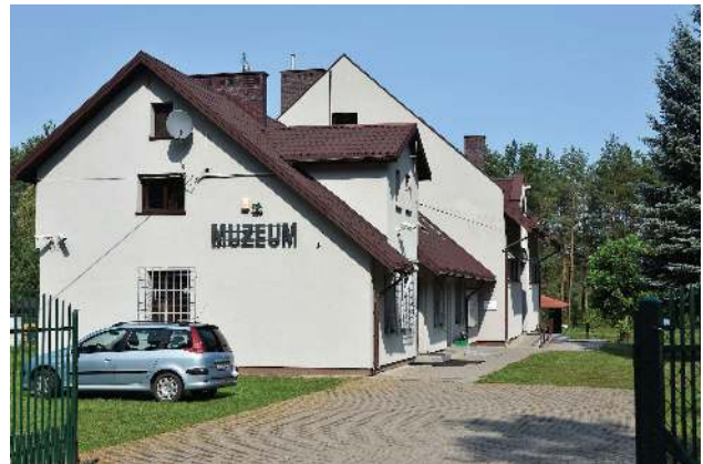
Das Museum in Treblinka

Er macht uns auf den Brief von S. Ziegelbojm aufmerksam, der nach London geflohen war und der durch die Berichte des Jan Karski und anderer wusste, was 1942-43 in Warschau und Treblinka geschah, und der die Welt vergeblich auf den Massenmord an den polnischen Juden aufmerksam zu machen versuchte und sie zum Eingreifen bewegen wollte. Am 12. Mai 1943 nahm er sich das Leben, um so das Los der Warschauer Juden zu teilen.