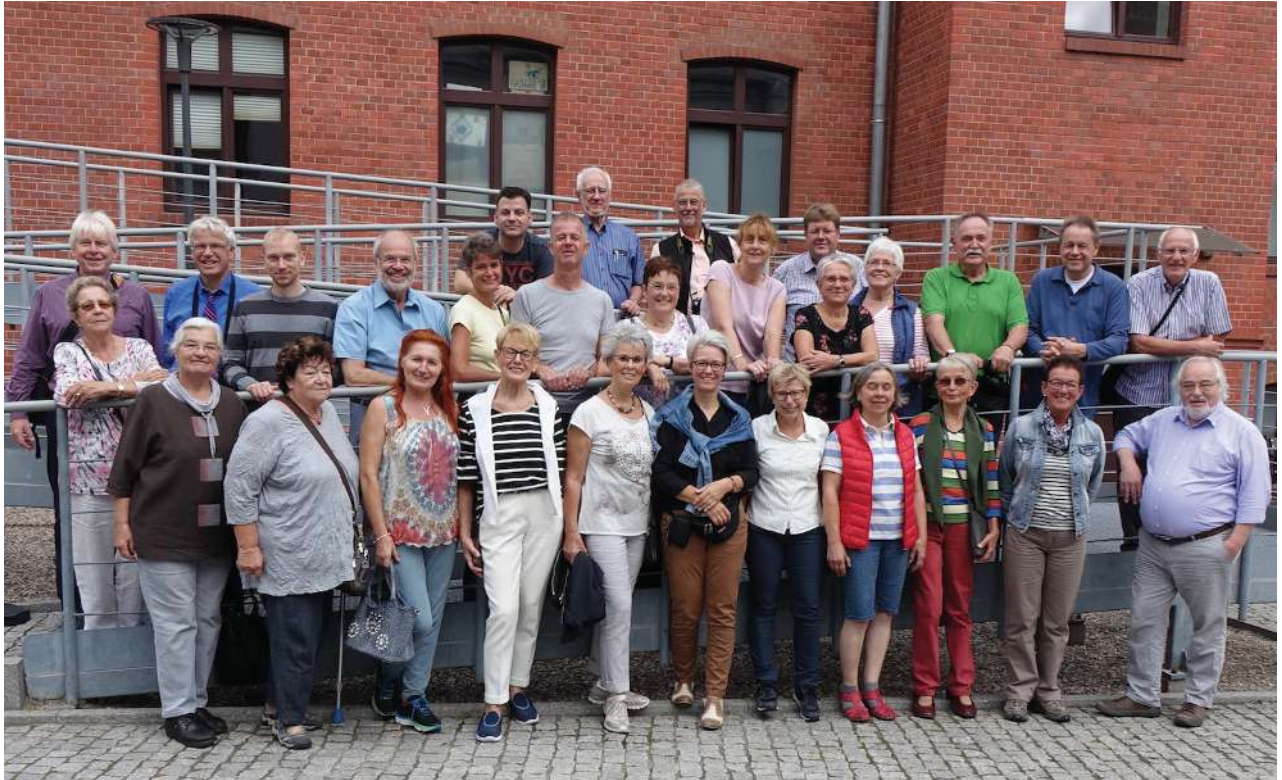
Die Teilnehmerinnen und Teilnehmer

Wir danken Hartmut Ziesing (Ziesing - Bildungs- und Studienreisen) sehr herzlich für die ausgesprochen kompetente Planung und fach- und sprachkundige sowie sehr umsichtige, angenehme wie informative Reiseleitung. Wir Teilnehmerinnen und Teilnehmer haben sehr davon profitiert.