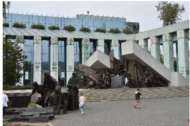
Denkmal für den Warschauer Aufstand

Die deutsche Besatzung zu besiegen, bevor die Rote Armee die Vorherrschaft über Polen übernehmen könnte, also die Unabhängigkeit Polens zu verteidigen.