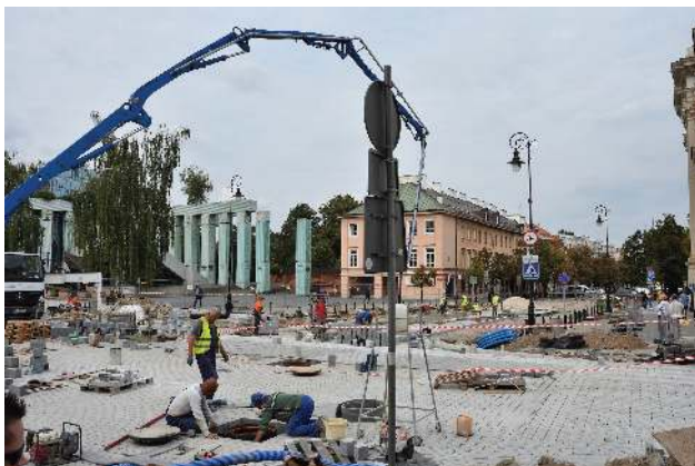
Eine der vielen Baustellen in Warschau

Treblinka als Vernichtungslager, in relativer Nähe. Polen hat im Krieg durch Ermordung und weitere Kriegseinwirkungen 6,5 Millionen Menschen, jüdische und nichtjüdische, verloren. Diese Menschen und ihre Nachkommen fehlen ja noch heute.