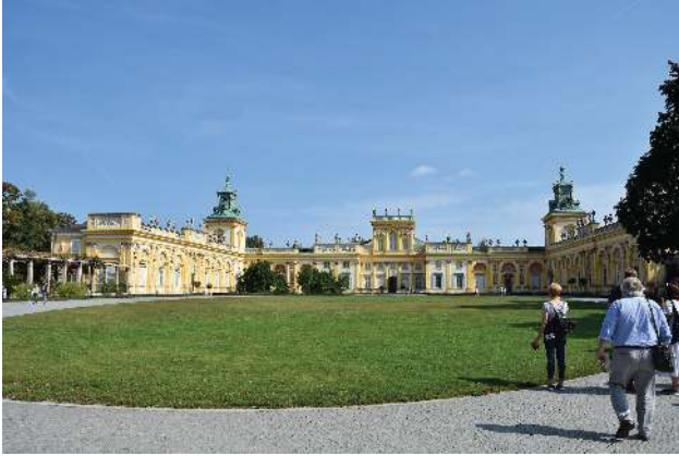
Schloss Wilanow, unten mit Rosengarten

Türken) hin, und auf die schönen Ausblicke auf den Park. Leider schieben sich außer uns noch viele andere Besuchergruppen durch die Räume, aber wir bekommen doch einen Eindruck dieser barocken Pracht, der Möbel, Fußböden, Wände und Decken.