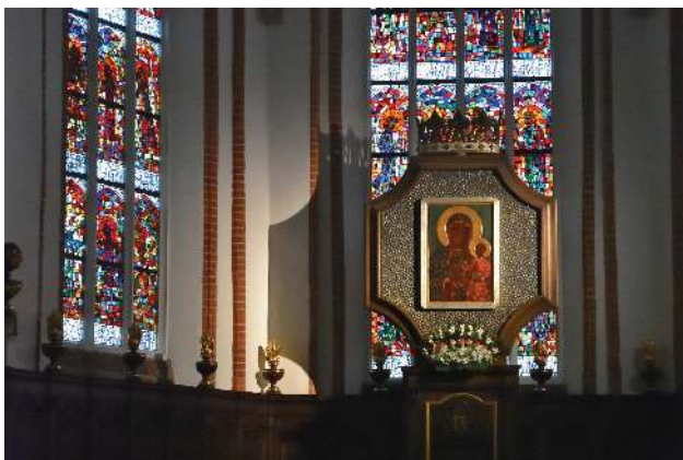
In der Johannes-Kathedrale