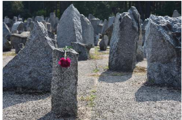
Wir legten an diesem schrecklichen Ort Blumen nieder

Wir sprechen immer wieder davon, auch weil unsere gesellschaftliche, deutsche Gegenwart das verlangt. Wir sind alle Menschen, und offenbar haben wir das alles auch in uns. Das glaube ich persönlich wirklich.