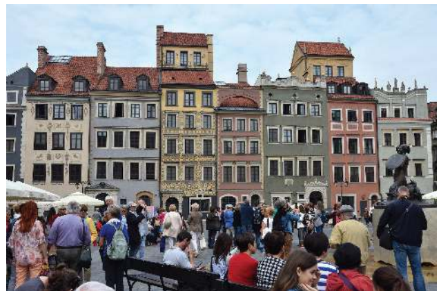
Altstadtmarktplatz in Warschau

Wäre ich Pole, hätte ich vermutlich großen Anteil am polnischen Nationalstolz. In ihm sind die NS-Verbrechen und die Folgen für Polen aufbewahrt. Vielleicht sind sogar die Anti-EU-Gesetzgebungen der PiS-Regierung vor allem ein Versuch, der gefühlten Umklammerung und vielleicht teilweise unbewussten Sorge vor neuer Überwältigung zu entgehen.