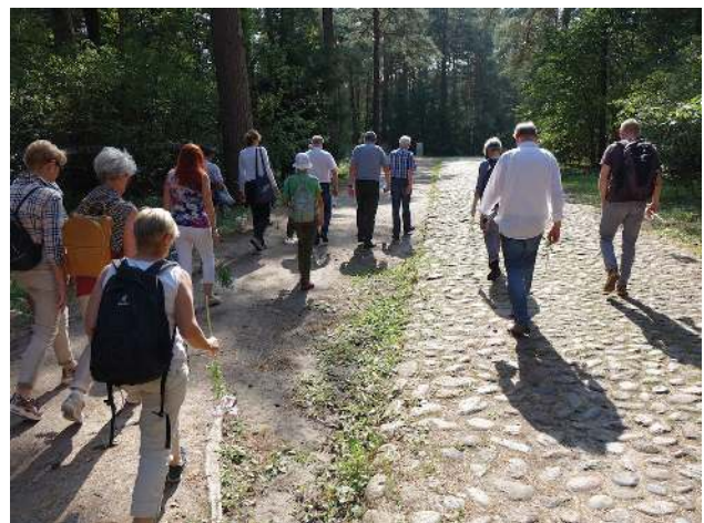
Wir gehen schweigend

https://de.wikipedia.org/wiki/Vernichtungslager_Treblinka