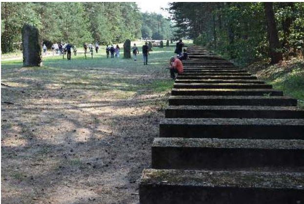
Symbolhafte Bahnschwellen auf historischem Gleisbett

wurden in die mit lebenden Menschen vollgestopften Gaskammern geleitet, die Opfer erstickten qualvoll an dem Kohlenmonoxyd. Nach 20-30 Minuten wurden die Gaskammern geöffnet, die Leichen ausgebeutet (Goldzähne z.B.) und zunächst in riesige Massengräber geworfen. Anfang März 1943 ließ die SS die Massengräber öffnen und die Leichen verbrennen.